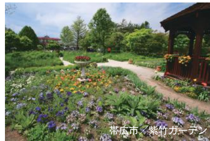
帯広市／紫竹ガーデン