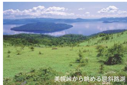
美幌岬から眺める屈斜路湖