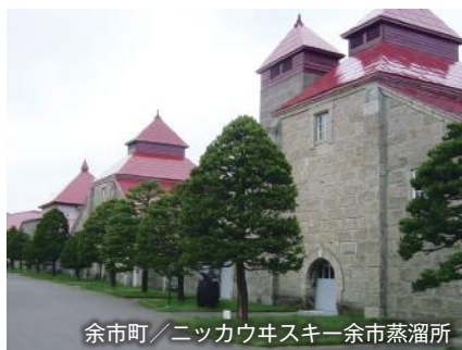
余市町／ニッカウヰスキー余市蒸溜所