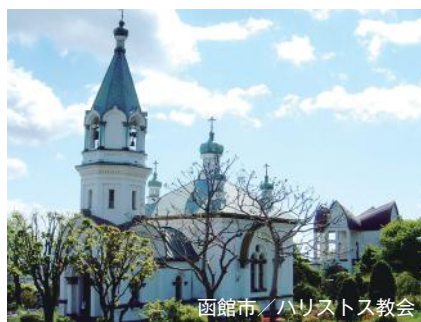
函館市／ハリストス教会