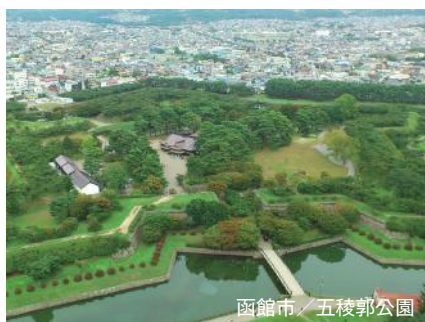
函館市／五稜郭公園