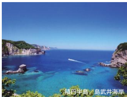
積丹半島／島武井海岸