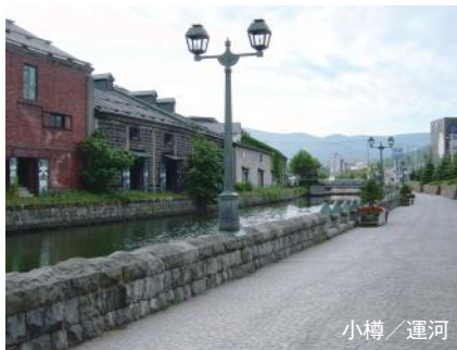
小樽 / 運河