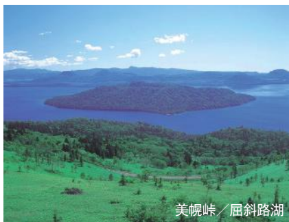
美幌峠 / 屈斜路湖