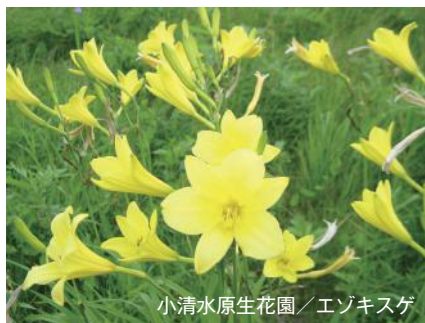
小清水原生花園 / エゾキスゲ