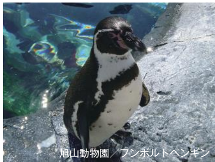
旭山動物園 / ファンボルトペンギン