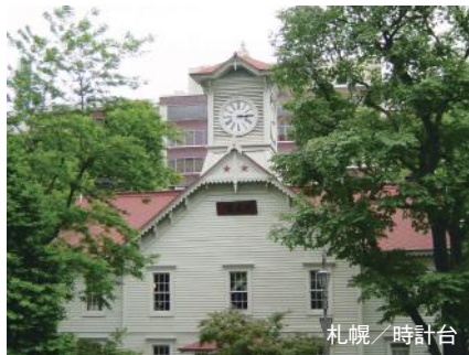
札幌 / 時計台