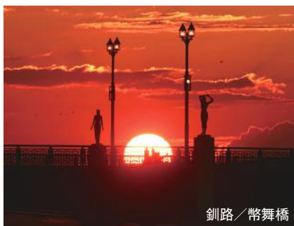
釧路 / 幣舞橋