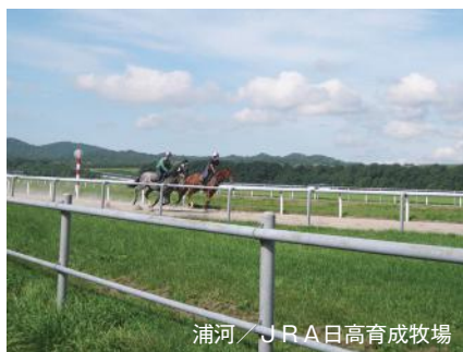
浦河 / JRA日高育成牧場

北海道の雄大な自然を存分に楽しめる「道東」。 数々の名馬を生んだ牧場が点在するサラブレッドの故郷日高では、 JRA日高育成牧場の施設見学に参加して北海道らしさを実感。 釧路湿原、霧多布湿原、野付半島の風景は道東ならではの。 原生花園の可憐な花々が旅人の訪れを待っています。 世界遺産知床で知床五湖の遊歩道を散策すれば、 野生生物とも遭遇できるかもしれません。 また、美幌峠から眺める屈斜路湖の絶景、 神秘的な魅力の摩周湖も見もののひとつ。 さらに、人気観光地富良野や美瑛まで、 北海道の多様な魅力をお楽しみいただけるコースです。