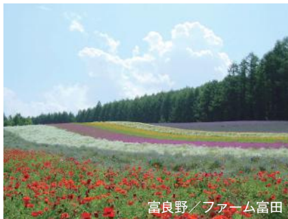
富良野 / ファーム富田