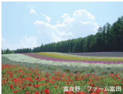
富良野／ファーム富田