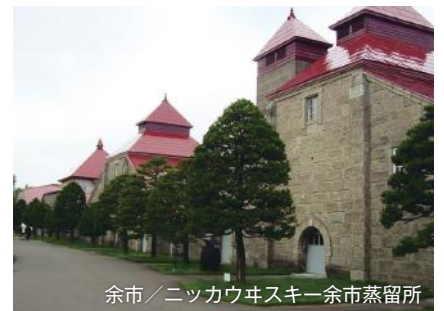
余市／ニッカウキスキー余市蒸留所