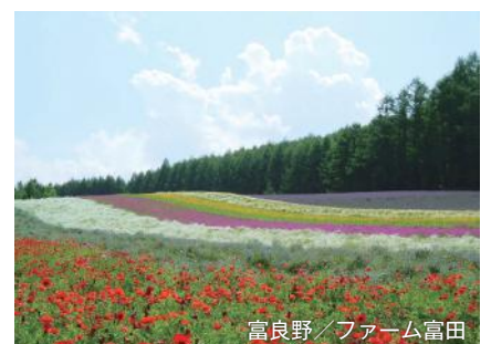
富良野／ファーム富田