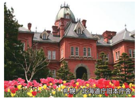
札幌／北海道庁旧本庁舎