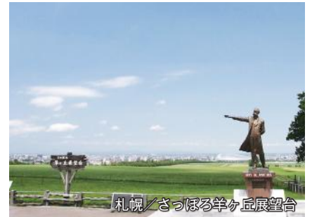
札幌／さっぽろ羊ヶ丘展望台