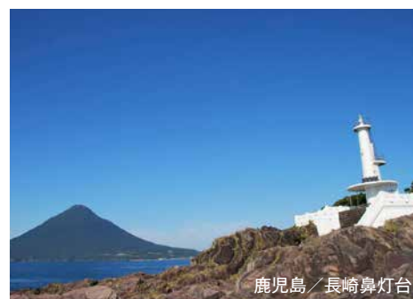
鹿児島／長崎鼻灯台