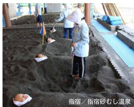
指宿／指宿砂むし温泉