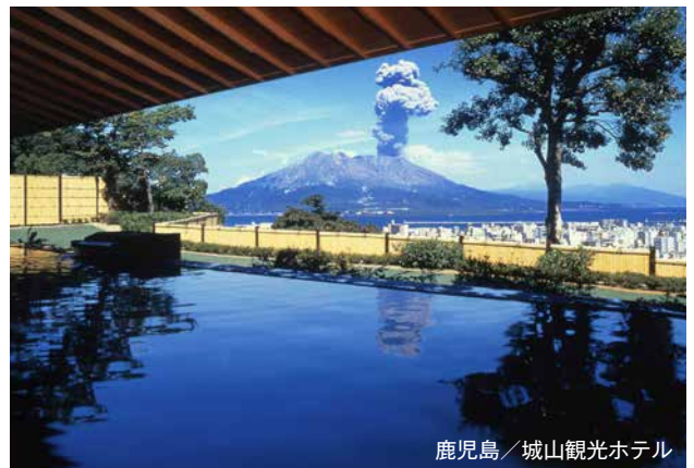
鹿児島／城山観光ホテル