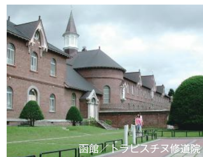
函館/トラピスチヌ修道院