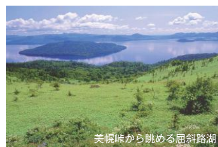
美幌岬から眺める屈斜路湖