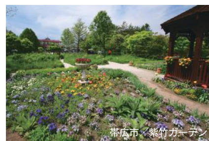
帯広市／紫竹ガーデン