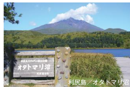
利尻島／オタトマリ沼