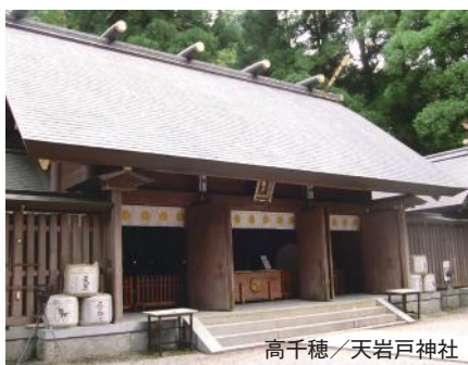
高千穂 / 天岩戸神社