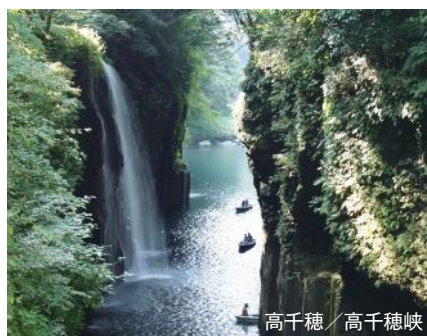
高千穂 / 高千穂峡