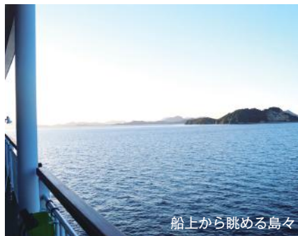
船上から眺める島々