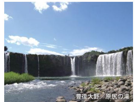
豊後大野 / 原尻の滝