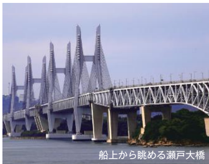
船上から眺める瀬戸大橋