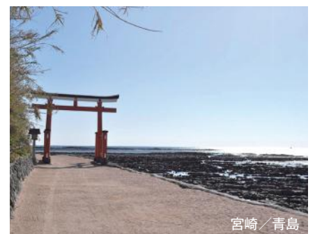
宮崎 / 青島