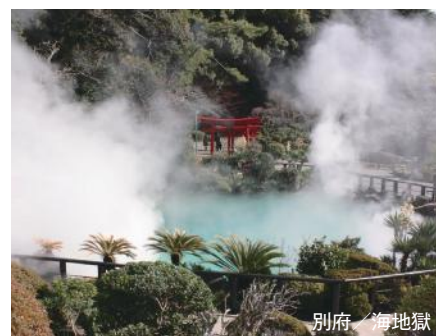
別府 / 海地獄