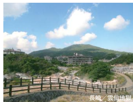
長崎 / 雲仙地獄