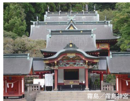
霧島 / 霧島神宮

2018年7月9日(月)～8月30日(木)の出発 / 7泊8日 ※お盆期間等、設定除外日あり