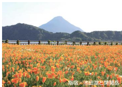
指宿 / 池田湖と開聞岳