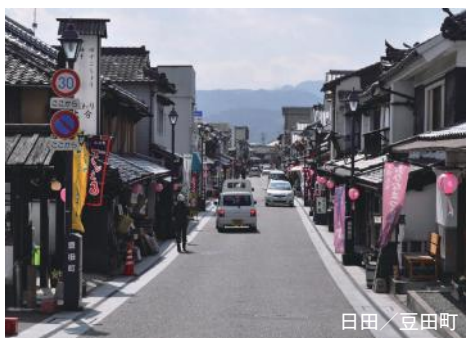
日田 / 豆田町