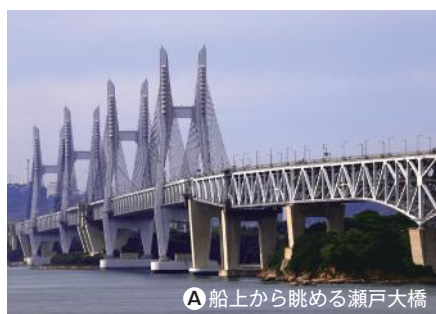
A 船上から眺める瀬戸大橋