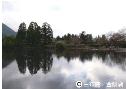
C 由布院 / 金鱗湖