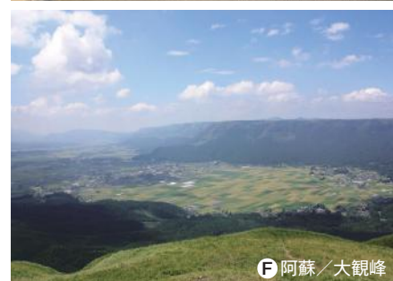
F 阿蘇 / 大観峰