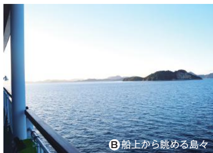
B 船上から眺める島々