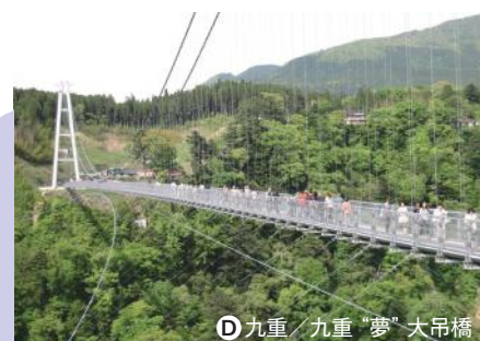
D 九重 / 九重“夢”大吊橋