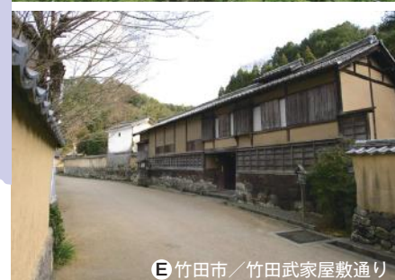
E 竹田市 / 竹田武家屋敷通り