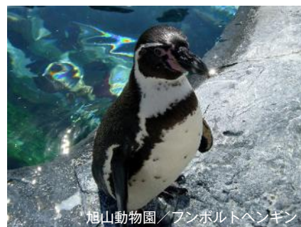
旭山動物園 / ファンホルトペンギン