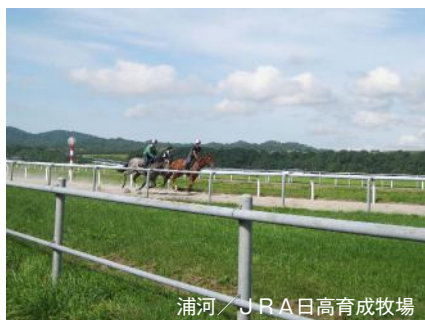
浦河 / JRA日高育成牧場