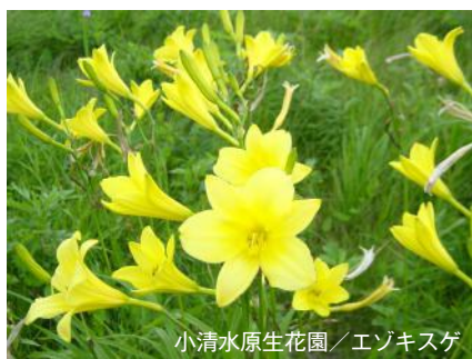
小清水原生花園 / エゾキスゲ