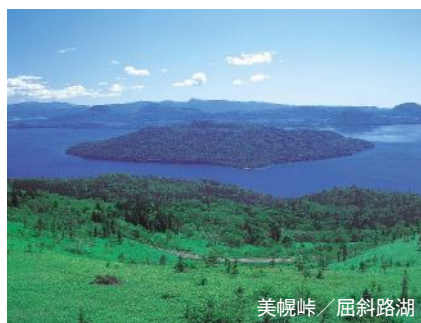
美幌峠 / 屈斜路湖