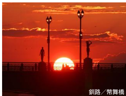
釧路 / 幣舞橋