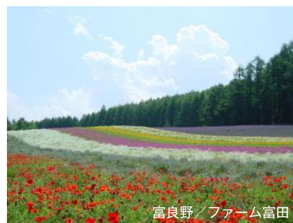
富良野 / ファーム富田