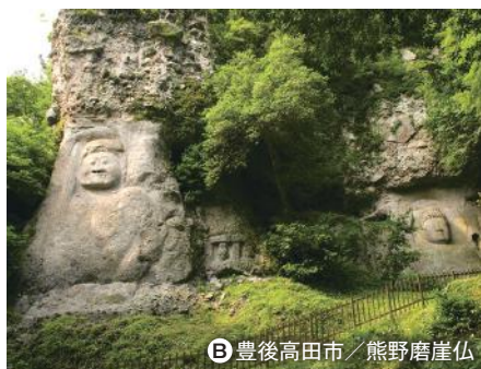
② 豊後高田市／熊野磨崖仏