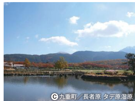
③ 九重町／長者原 タテ原温泉