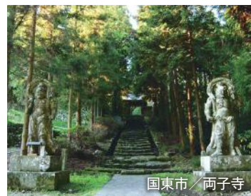
国東市 / 両子寺