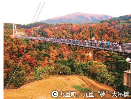
③ 九重町／九重“夢”大吊橋