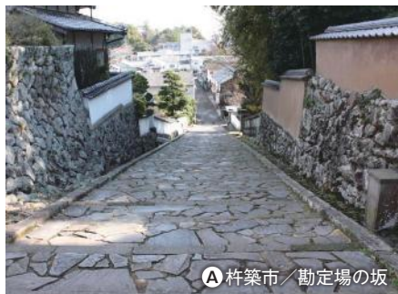
A 杵築市/勘定場の坂