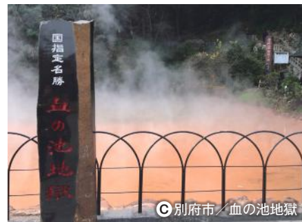
C 別府市/血の池地獄