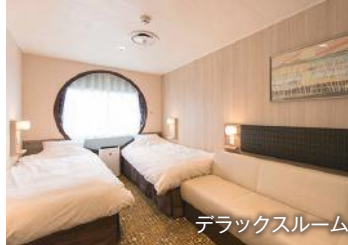
デラックスルーム