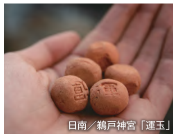
日南/鶴戸神宮「運玉」