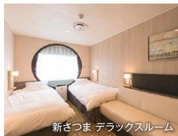
新さつま デラックスルーム