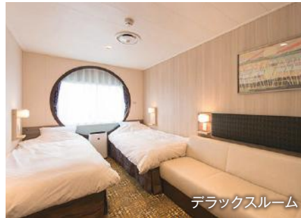
デラックスルーム