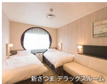
新ざつま デラックスルーム