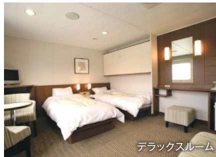
デラックスルーム