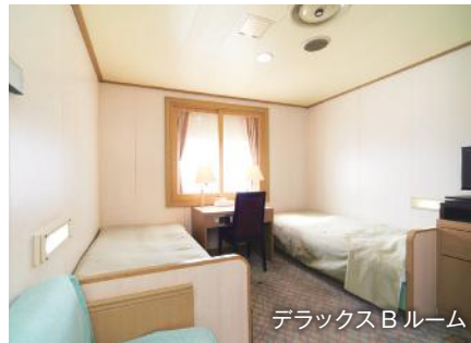
デラックスBルーム