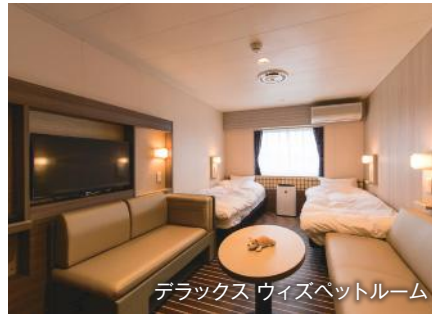
デラックス ウィズペットルーム