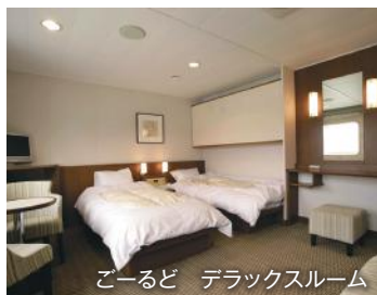
ごーど デラックスルーム