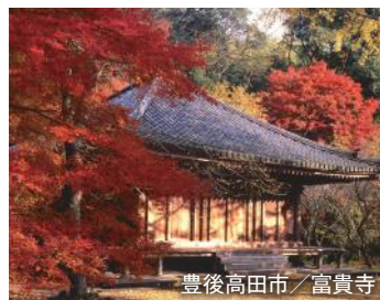
豊後高田市 / 富貴寺