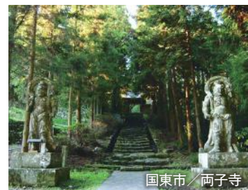
国東市 / 両子寺