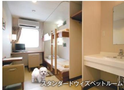
スタンダードウィズペットルーム