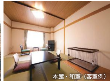
本館・和室（客室例）