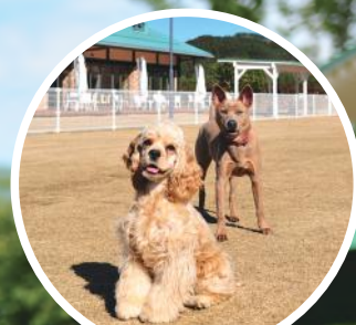
ペットといっしょ!