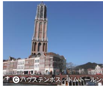
◎ハウステンボス/ドムトールン