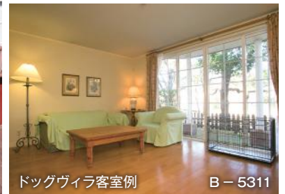
ドッグヴィラ客室例