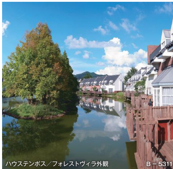
ハウステンボス／フォレストヴィラ外観