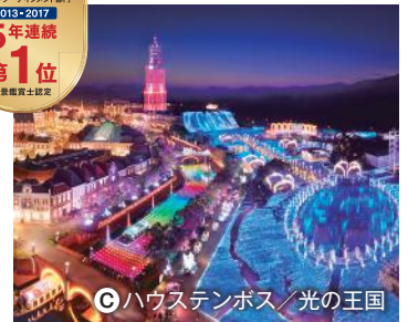
◎ハウステンボス/光の王国