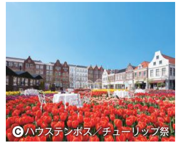
◎ハウステンボス/チューリップ祭