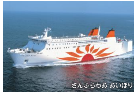
さんふらわあ あいぼり

船室：ツーリストベッド（相部屋） 設備：電源コンセント 備品：スリッパ、救命胴衣