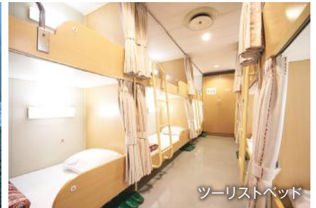
ツーリストベッド