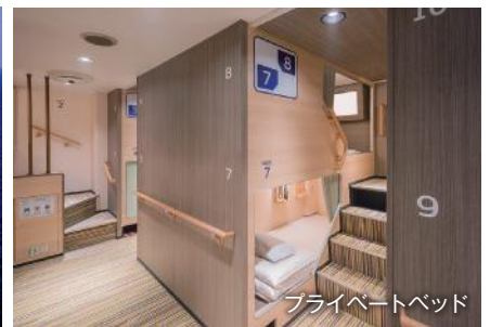
プライベートベッド