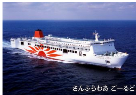
さんふらわあ ごーど

船室：プライベートベッド（相部屋） 設備：テレビ、電源コンセント、荷物スペース 備品：ハンガー、タオル、歯ブラシ、スリッパ、イヤホン、救命胴衣