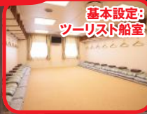
基本設定: ツーリスト船室