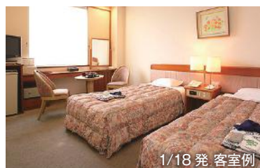
1/18 発 客室例