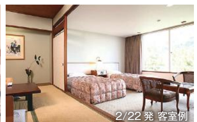
2/22 発 客室例

食事：夕 食事処にて会席料理 朝 レストランまたは宴会場にてバイキング 客室：1/18 発：花の棟(洋室) 2/22 発：薩摩客殿(和洋室)