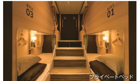
プライベートベッド