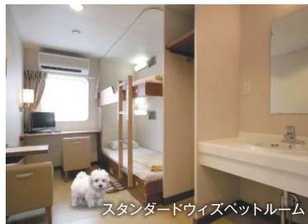
スタンダードウィズペットルーム