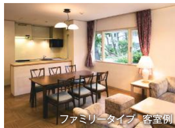
ファミリータイプ 客室例