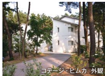
コテージ・ヒムカ 外観