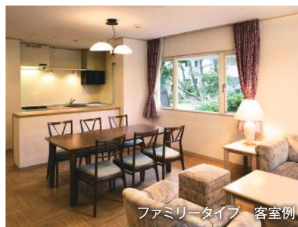
ファミリータイプ 客室例

広大な敷地内にある黒松林の中に佇むリゾート感覚のコテージ。静かな環境の中でリラックスしてお過ごしいただくことができます。サンビーチ葉まで徒歩約10分。整備された人工ビーチは、お散歩にぴったりです。