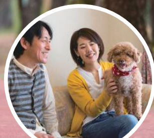
ペットといっしょ!