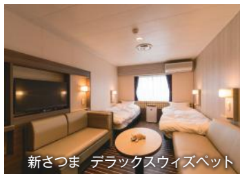
新ざつま デラックスウイズベット