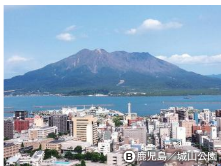
B 鹿児島 / 城山公園