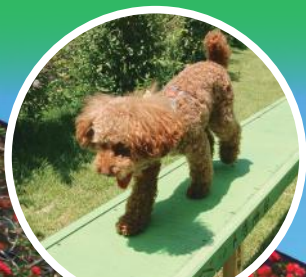
ペットといっしょ!