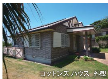
コットンズハウス 外観