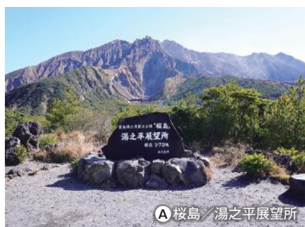
A 桜島 / 湯之平展望所