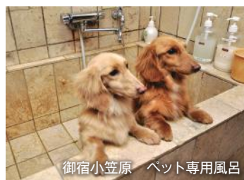
御宿小笠原 ペット専用風呂