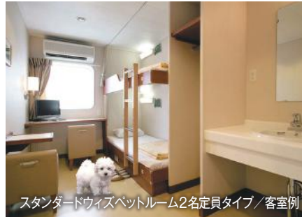
スタンダードウィズペットルーム2名定員タイプ/客室例