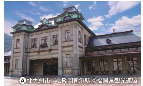
A 北九州市 / JR 門司港駅