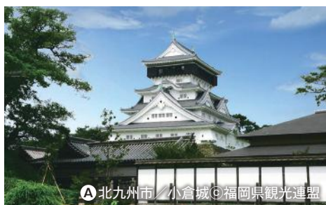
A 北九州市 / 小倉城