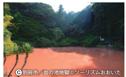
C 別府市 / 血の池地獄