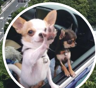
ペットといっしょ!