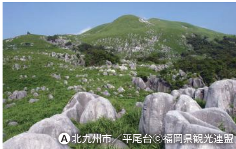
A 北九州市 / 平尾台