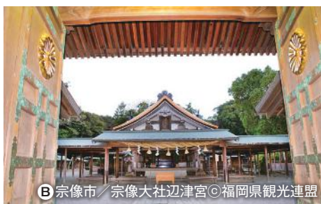
B 宗像市 / 宗像大社辺津宮