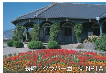
長崎/グラバー園