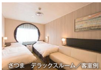
さつま デラックスルーム/客室例