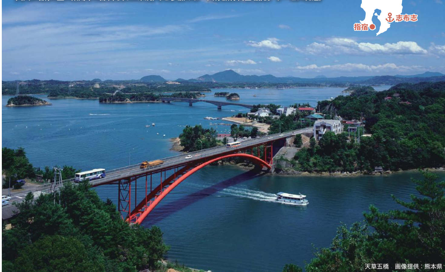
天草五橋