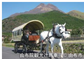
由布院観光辻馬車

鹿児島・志布志港から桜島の眺望を楽しみ、名物「砂むし温泉」で知られる指宿へ。阿蘇や天草五橋では美しい景観とドライブをお楽しみください。そして雲仙の広大な自然を感じながら異国情緒溢れる長崎、さらには人気の由布院まで巡る、南から西、東九州エリアを縦断するコースです。