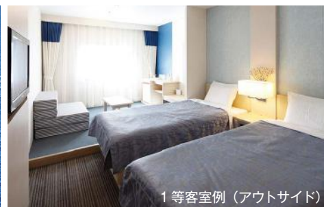
1等客室例(アウトサイド)