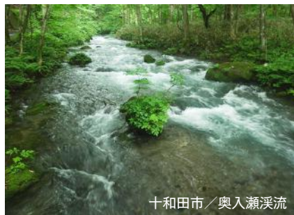
十和田市／奥入瀬溪流