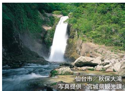
仙台市／秋保大滝