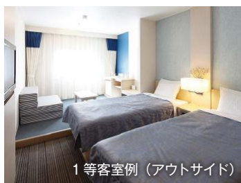
1等客室例(アウトサイド)