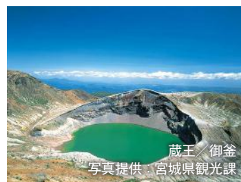
蔵王/御釜