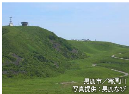
男鹿市／寒風山