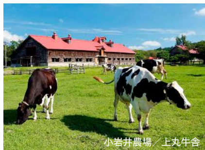
小岩井農場／上丸牛舎

※モデルコースはあくまでも一例であり、走行距離は概算です。実際の走行距離とは異なる場合があります。宿泊地・港に向け、ご自由にドライブプランを組み立て、お楽しみください。