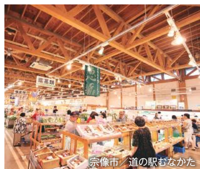
宗像市/道の駅むなかた