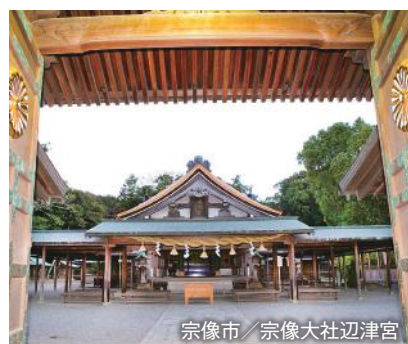
宗像市/宗像大社辺津宮