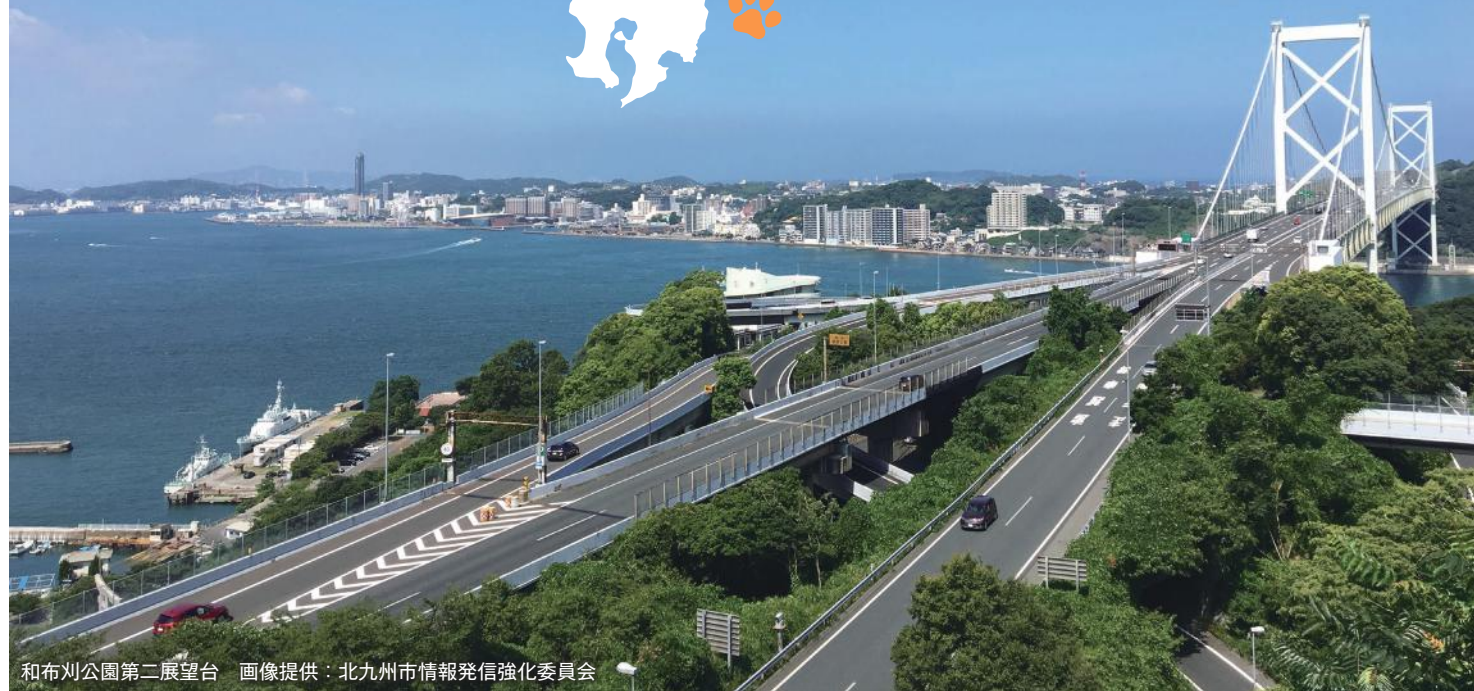
和布川公園第二展望台