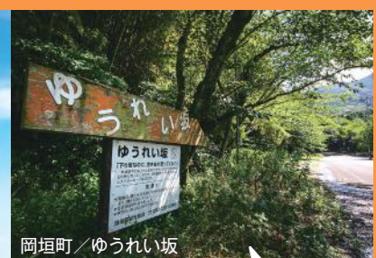
岡垣町/ゆうれい坂