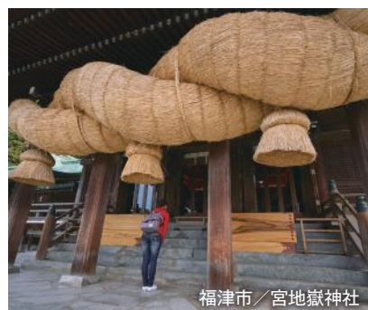
福津市/宮地嶽神社

※フェリー発着時刻は予告なく変更する場合があります。 ※モデルコースはあくまでも一例であり、走行距離は概算です。実際の走行距離とは異なる場合があります。 宿泊地・港に向け、ご自由にドライブプランを組み立て、お楽しみください。