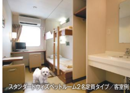
スタンダードウィズペットルーム2名定員タイプ/客室例