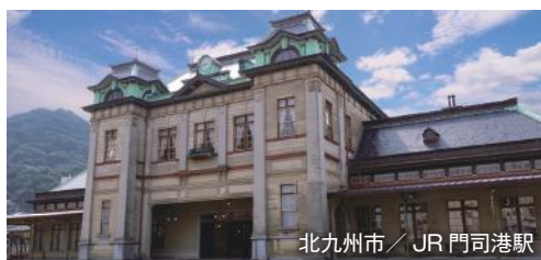
北九州市/JR 門司港駅