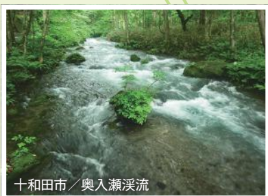
十和田市/奥入瀬溪流