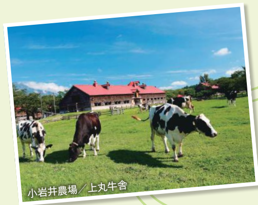
小岩井農場/上丸牛舎