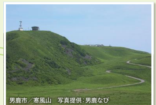
男鹿市/寒風山